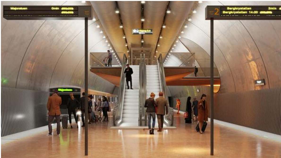
Skøyen T-banestasjon. Bilde: Gottlieb Paludan Architects og L2 Arkitekter.

Arkitekter: Gottlieb Paludan Architects (DK) og L2 Arkitekter (NO)