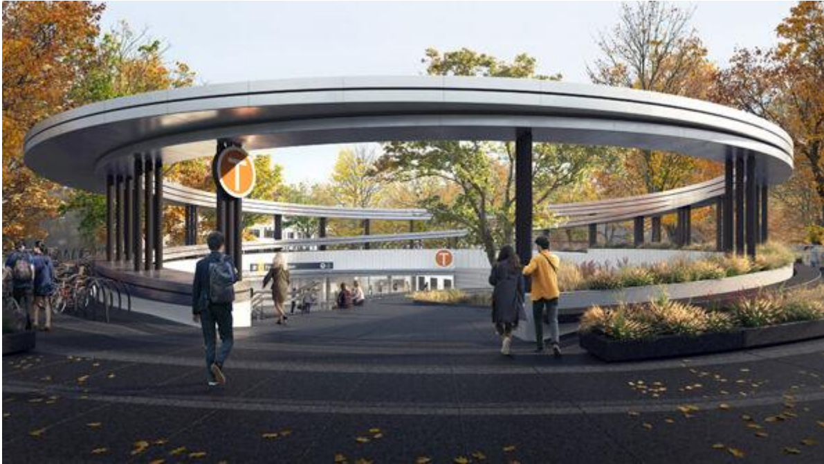
Fornebuporten T-banestasjon. Bilde: Zaha Hadid Architects og A-lab

Arkitekter: Zaha Hadid Architects (UK) og A-Lab (NO)