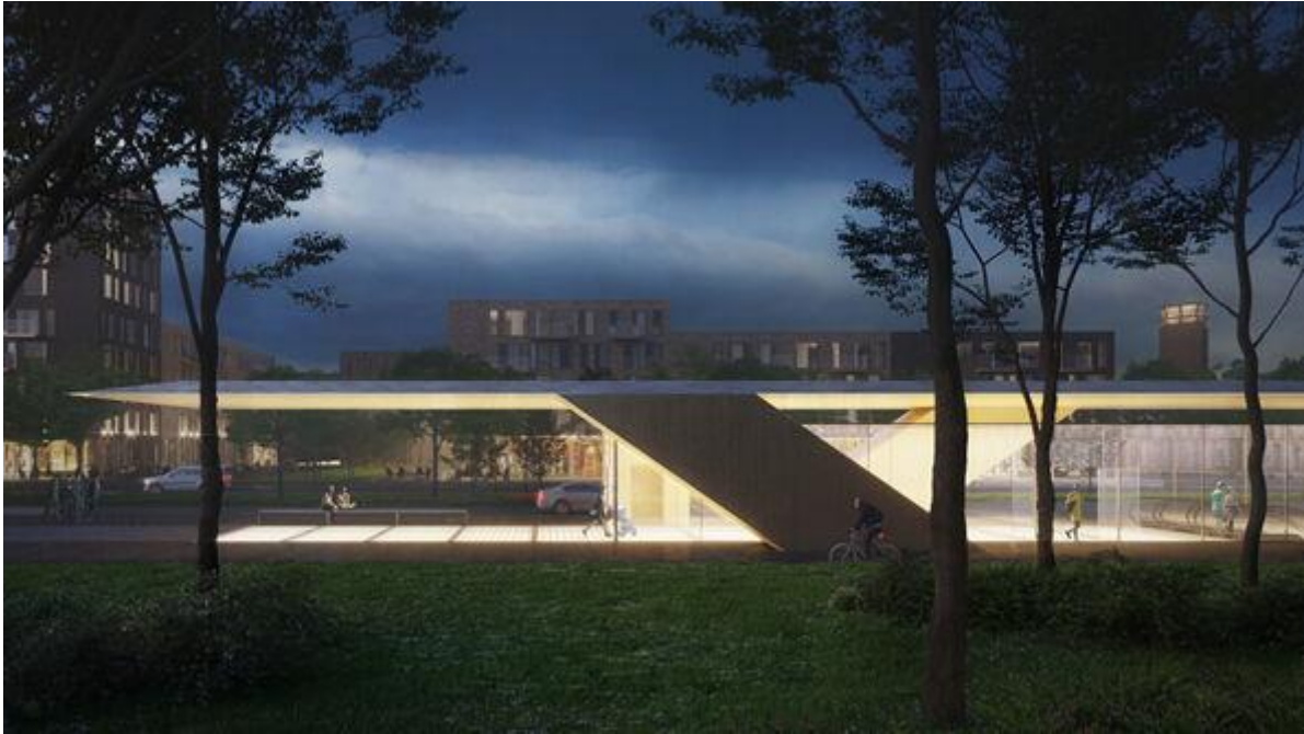
Flytårnet T-banestasjon. Bilde: Mestres Wåge, Imago-Atelier de Arquitectura Engharia Lda og José Gigante – Arquitecto Ld

Arkitekter: Mestres Wåge Arquitectes AS (NO/ES), Imago-Atelier de Arquitectura Engharia Lda (ES) og José Gigante – Arquitecto Lda (ES)