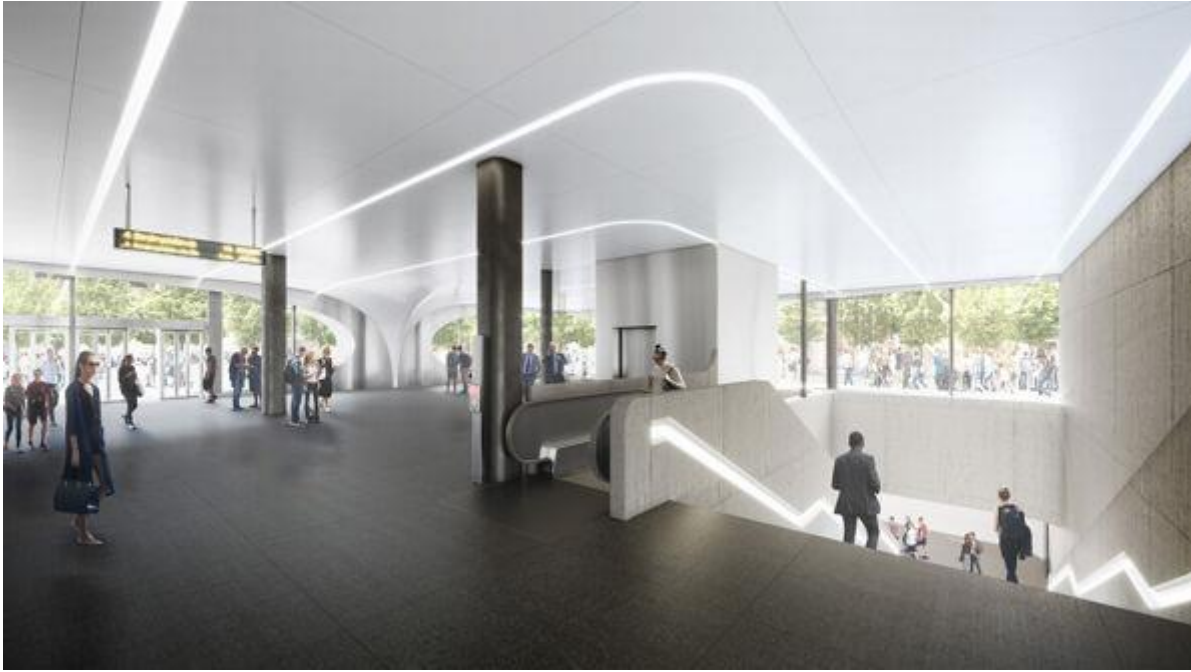
Fornebu T-banestasjon. Bilde: Zaha Hadid Architects og A-lab

Arkitekter: Zaha Hadid Architects (UK) og A-lab Arkitekter (NO)