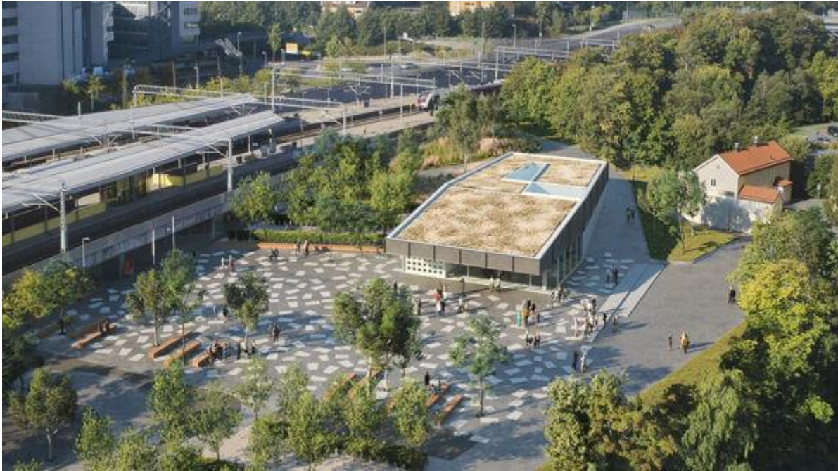
Lysaker T-banestasjon. Bilde: Asplan Viak, Longva Arkitekter og Arup.

Arkitekt: Asplan Viak (NO), Longva Arkitekter (NO) og Arup (DK)