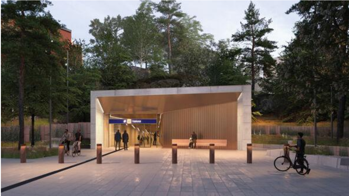
Vækerø T-banestasjon. Bilde: Gottlieb Paludan Architects og L2 Arkitekter.

Arkitekt: Gottlieb Paludan Architects (DK) og L2 Arkitekter (NO)