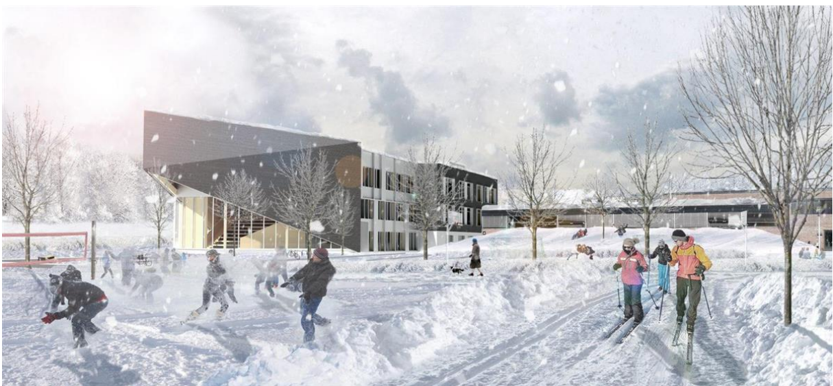
Bleiker videregående skole Jostein Rønsen Arkitekter AS

Viken fylkeskommune inviterer profesjonelle kunstnere til å søke åpen prekvalifisering for kunstoppdrag ved Bleiker videregående skole. Søknadsfristen er 1. januar 2021.