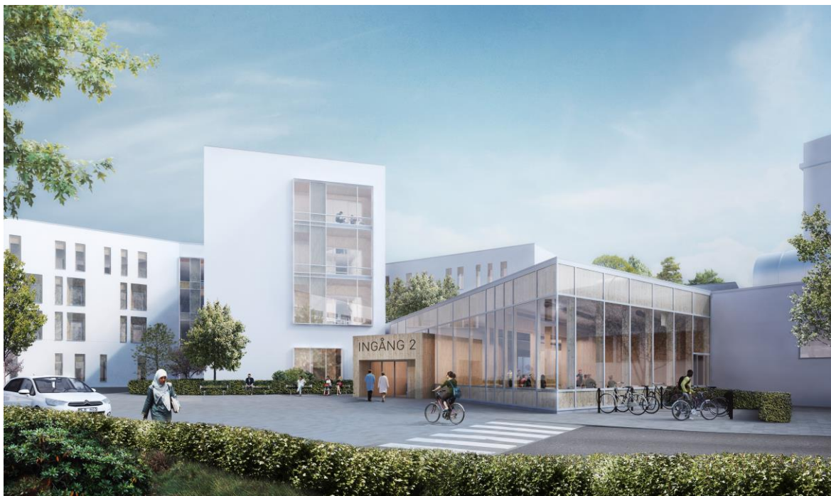
Ingång till Psykiatrins kvarter. Bild: White