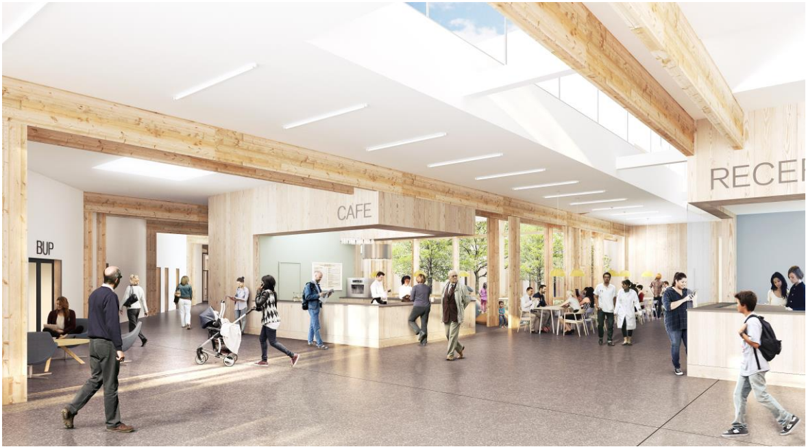
Ingång 2, entrétorg inomhus. Bild: White