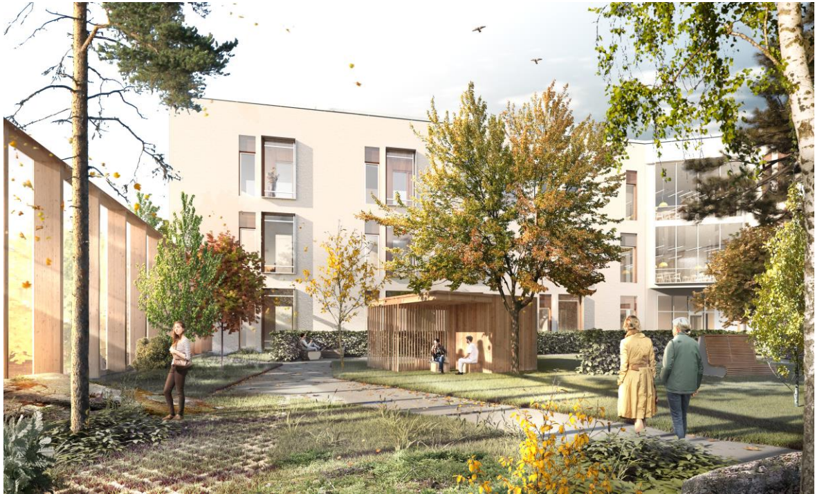
Gård utomhus VUP. Bild: White