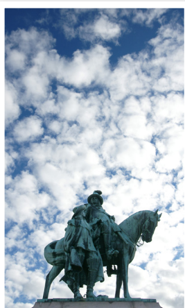
På Kungstorget finns idag en ryttarstaty av Teodor Lundberg från 1915.

Välkommen att anmäla ditt intresse senast 26 mars!